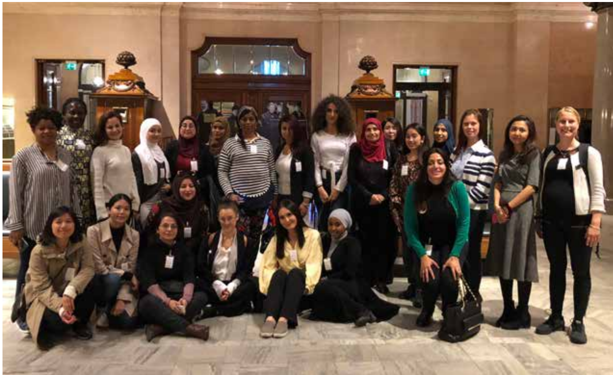
Demokratiambassadörer på studiebesök i riksdagen, september 2018